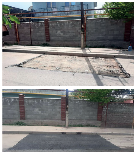
НАУРЫЗБАЙ АУДАНЫ. С.ЛАПИН КӨШЕСІ, 110. 12М2