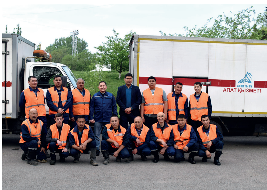
Су құбыры департаментінің Бостандық ауданы пайдалану учаскесі