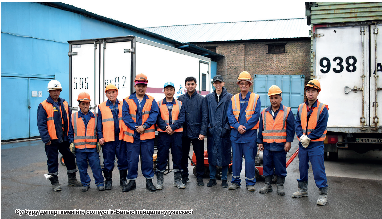
Су бұру департаментінің солтүстік-Батыс пайдалану учаскесі

авариялық қызметтер жұмысының маңызды критерийлерінің бірі болып табылады. Айдың қорытындысы бойынша әкімнің қоғамдық қабылдауынан түскен өтінімдердің орындалуын талдау бойынша үздік бригадалар деп танылды: Су құбыры департаментінің Бостандық ауданы пайдалану учаскесі Су бұру департаментінің солтүстік-Батыс пайдалану учаскесі. Су көздері департаментінің батыс учаскесі.