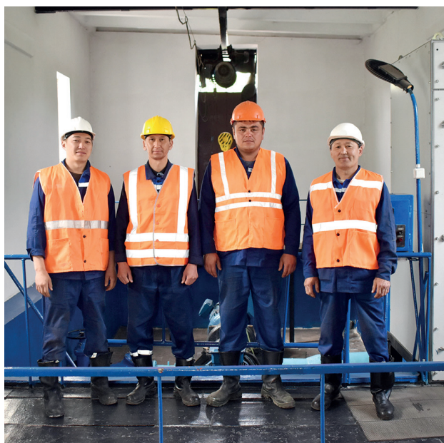
Су көздері департаментінің батыс учаскесі