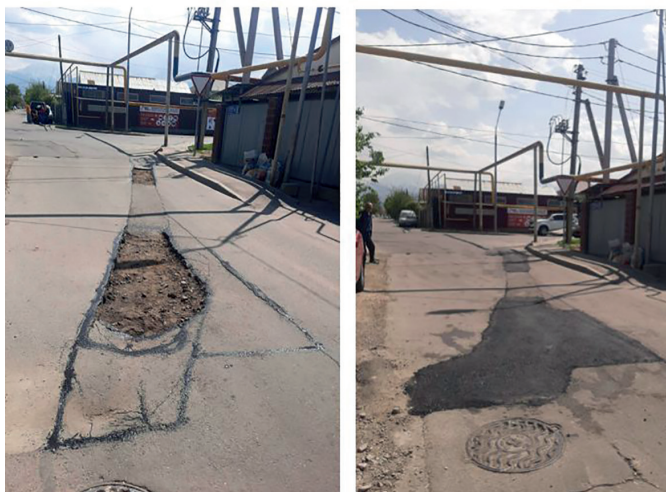
НАУРЫЗБАЙ АУДАНЫ. ҚОСЫНОВ КӨШЕСІ, БАЙЗАҚ БАТЫР КӨШЕСІНІҢ ҚИЫЛЫСЫ. 13,5М2